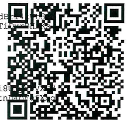
Imagen Digital del SAT gLcCjJ6vc/SuSQn7oCUisQQ44heH0bPvWC7RNOAfBbrFm+jtRm04X6qmCxFHxswxT5kmqj kpvNh1sa0Vz/kgazrQ3pmnrJFUftrs0LN+e9HXji8 h3TveIJjq5Hv8qoYJUVRkoXeiXq31iUfCPwStddq14SvE1N5Jh7eP9tbDZr4hMUPe0sdtec0XTDKukC/MXaFny7+ktwjgFVs5oBPbWi+fk0RRtn NAzj3xmf68sAfeIiWTiw0Rmc4hk5wEjsBcTe9oykr7LurSgVAeLA9tAyY0zMLD5GDMHgLnI1jNKznxqeckIcMfM2sSo3/hdW5DeAA==

Imagen Digital del Emisor LTzeDMoHm07oJBsTkuncBMNkpVbAx52gkDHNSvqCp8UPy/88xwD0lGIFoelqzjYVM2DasIvJFXUIrGL/hHUGEDP7f2cIbbGT4HHB7jf+Ntg/dB YVeGBvmltAcjG/XRncWiwalkK5bbj9CX+/ymyvsICDttYogufXMKF04SEEtXIR0jjH2OmK8HqhSwK3Od08e9JbDesnwJ03Fw2yGpFkj5JM++wTi NfIHczfLB+qvAGw2lbpLbZiUqjnsPFBSd3ufV32FRHITsGBkAHLkWfqJG4+6rRWdokiZrI02mI+6DYthv12QD7XVAtoocczJJ5/SFBQQ==