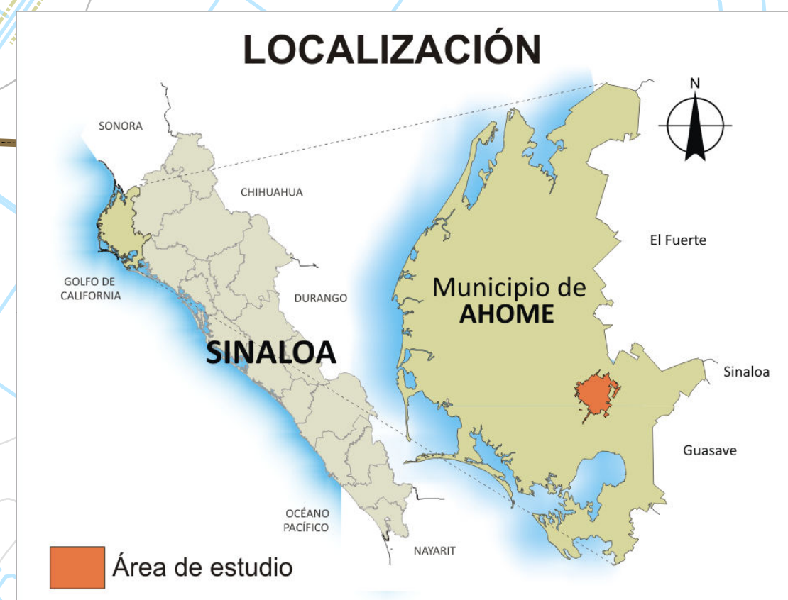
MAPA D-01.- DELIMITACIÓN DEL ÁREA DE ESTUDIO